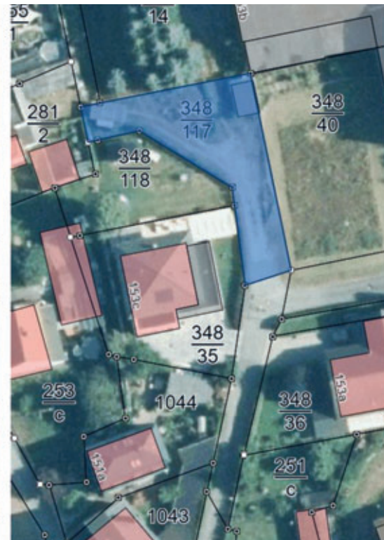
Teilfläche, die der öffentlichen Widmung entzogen wird